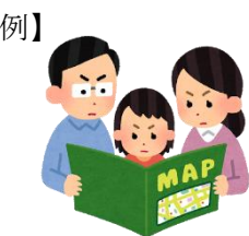
防災マップで避難場所 や避難経路を確認