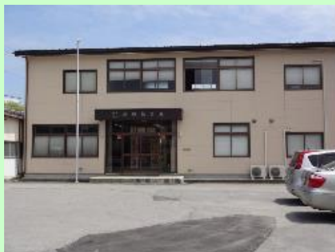
▲株式会社 岩瀬張建設社屋 外観