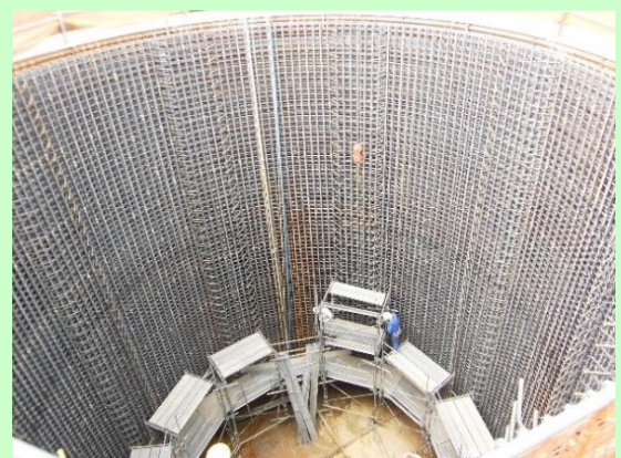
▲八戸久慈自動車道の橋脚建設現場(久慈市夏井町)

仕事で失敗したときや分からないことは、自分ひとりで抱え込まないで、作業ミスや事故を起こさないよう先輩や同僚に相談しています。