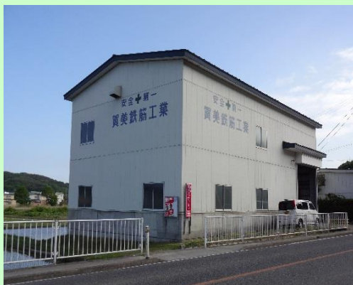
▲賀美鉄筋工業有限公司本社 外観

繁忙期の所定労働時間を長くする代わりに、閑散期の所定労働時間を短くするなど、業務の繁閑や特殊性に応じて、労働時間の配分等を行い、全体としての労働時間の短縮を図ろうとするもの