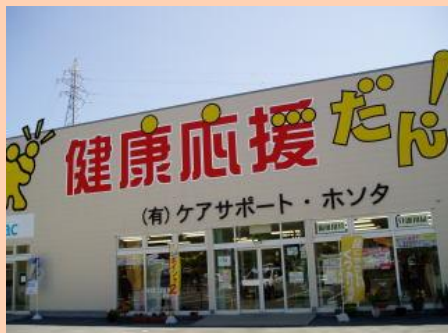
▲有限会社ケアサポートホソタ 外観