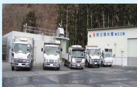
▲株式会社三陸水産 本社外観