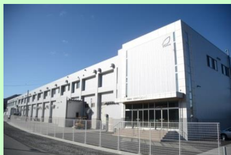
▲株式会社十文字チキンカンパニー久慈工場

多くの若手社員が働く職場です。まずは見学して、実際に自分の目で見て雰囲気を感じてほしいです。工場見学は若手が担当しますので、どんどん疑問を質問して下さい!