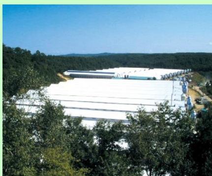
▲(株)ニチレイフレッシュファーム洋野農場外観