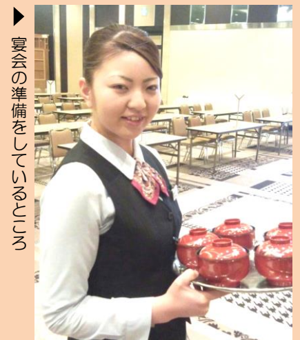
宴会の準備をしているところ