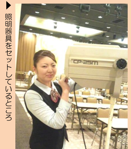
照明器具をセットしているところ

学生のうちに色々なことにチャレンジすることが大切だと思いますので、今のうちに多くのことを学んで下さい。