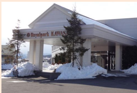
▲有限会社はたけた （ロイヤルパークカワサキ）外観

お客様あっての仕事なので、地域に根づき、お客様に愛され信頼される会社であることを目標としています。