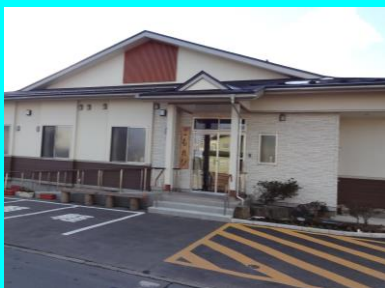
▲コミュニティルーム こもれび