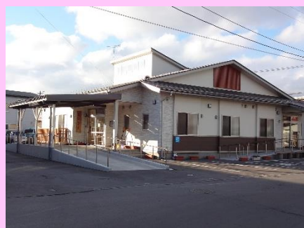
▲ファミリーサポートおひさま 外観