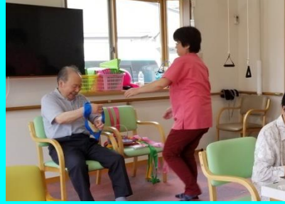
▲作業療法士による機能訓練