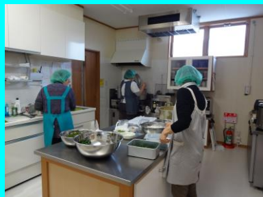
▲誕生日会のケーキなどごちそうを準備しているところ