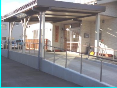
▲ファミリーサポート おひさま