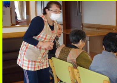
▲利用者様への思いやりを持った声がけも大切な仕事