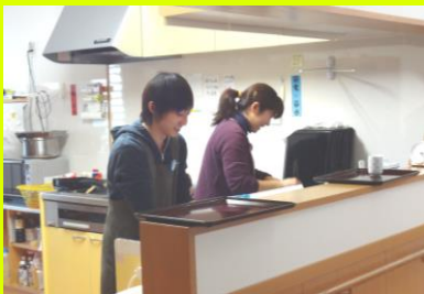
▲利用者様の食事の片付けをしているところ