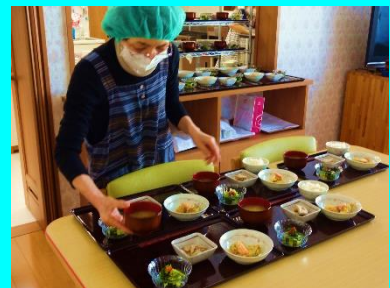
▲利用者様のお昼の準備をしているところ