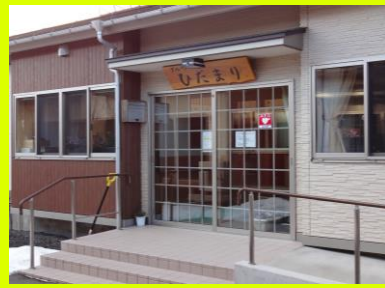
▲グループホーム ひだまり