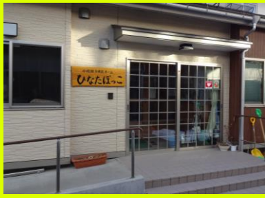
▲小規模多機能ホーム ひなたぼっこ