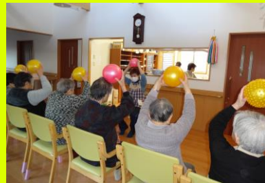
▲利用者様とレクリエーションをしているところ