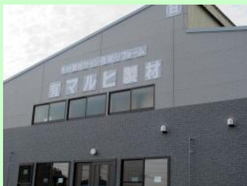
▲(株)マルヒ製材 新社屋