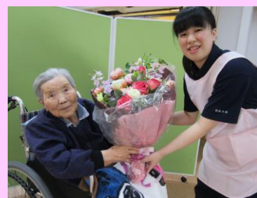
▲利用者の誕生会の様子