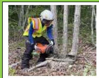
▲チェーンソーを使用し、伐倒しているところ

主に、切って倒した木を重機を使って規定の長さに刻み、運搬する作業を行っています。またチェーンソーを使い、伐採した木の幹から枝を切り離す「枝払い」という作業をしています。