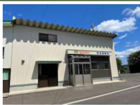
▲(有)丸大県北農林 外観