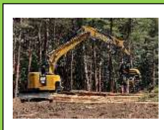
▲重機を操縦しているところ

プライベートではサーフィンにはまっているので、休日に楽しみ、リフレッシュしています！