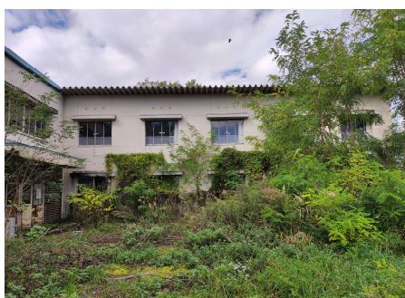
雑草や樹木が生い茂って 建物を覆っている例

令和3年3月31日現在の未利用資産144件について、必要な維持管理を実施しているかを把握するため、令和2年度中の現地確認の実施頻度を調査したところ、年に複数回実施しているものは96件、年に1回実施しているものは29件、実施していないものは19件であった。