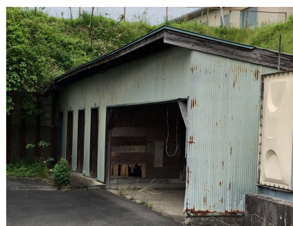
建物（物置）の戸が開いた ままとっている例