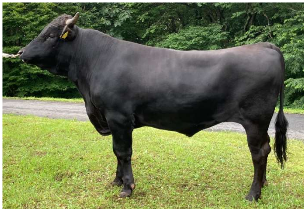
繁殖者：北上市 高橋 続人氏