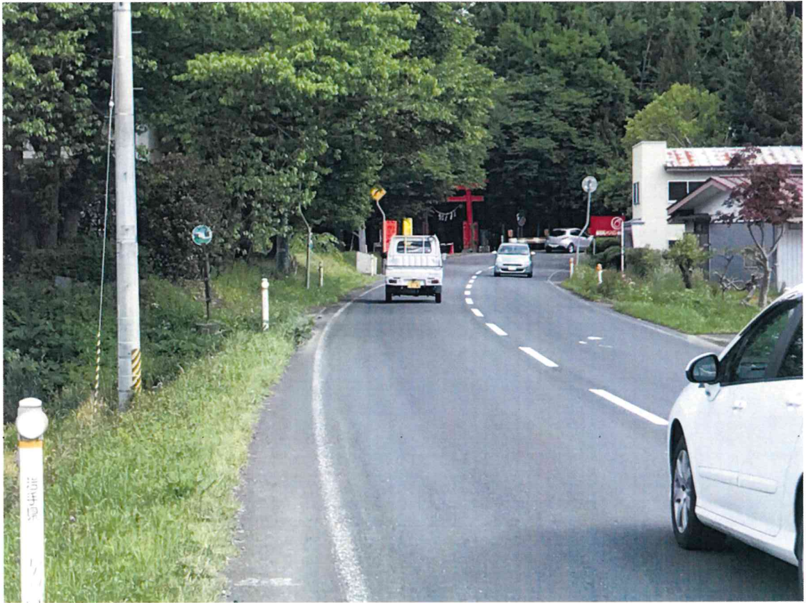
【奥州市水沢黒石町地内急カーブ狭隘区間】