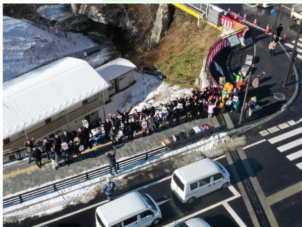
二戸市：都市計画道路荒瀬上田面線岩谷橋 (令和5年12月、完成イベント)