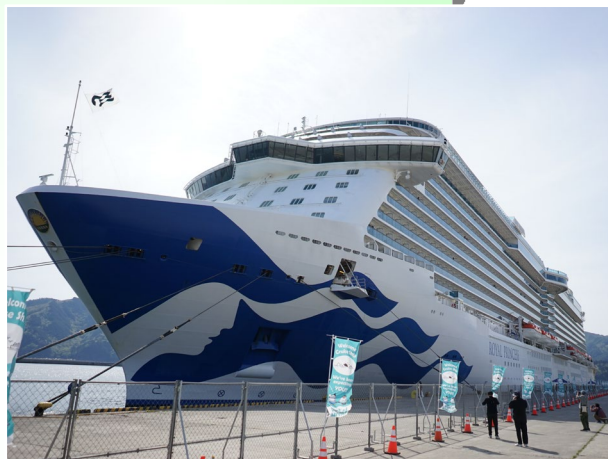
宮古市：ロイヤル・プリンセス寄港 (令和6年5月、宮古港)