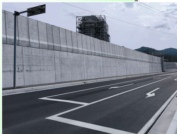
大船渡市：普金地区海岸防潮堤 (令和6年2月完成)