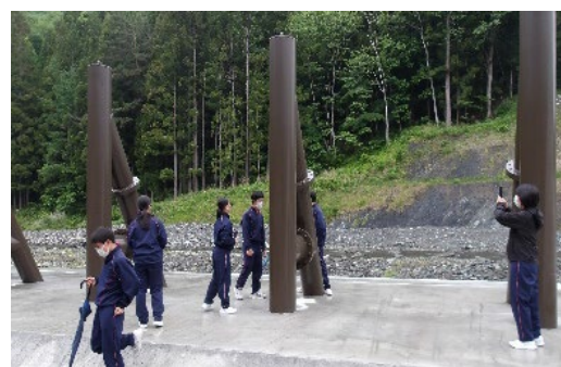
流木捕捉工の見学