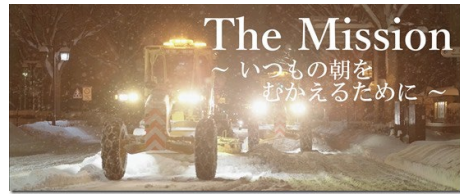
第2弾『The Mission ~いつもの朝をむかえるために~』