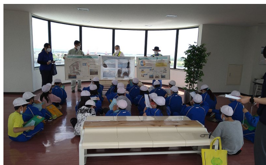
防災学習の状況 【久慈市立久慈湊小学校での出前講座の状況（県北広域振興局土木部）】