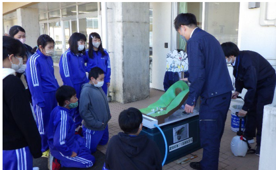
模型実験の状況 【山田町立船越小学校での出前講座の状況（宮古土木センター）】

座学での学習の他にも、模型を使用した実験や砂防堰堤や水門等の工事現場等の見学を行うなど、分かりやすい説明や体験により、防災に関する理解の向上に努めています。