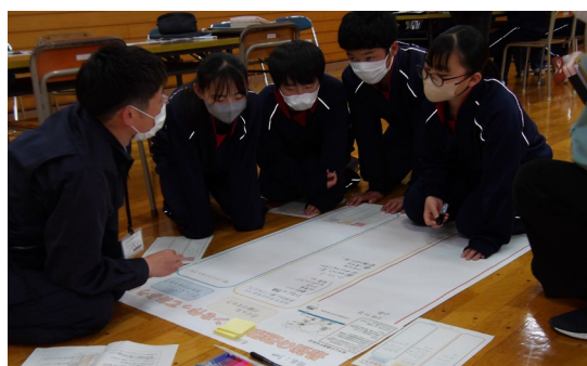
避難を考えるワークショップ 【岩泉町立小川中学校での出前講座の状況（岩泉土木センター）】