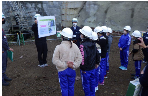
砂防堰堤の工事現場見学