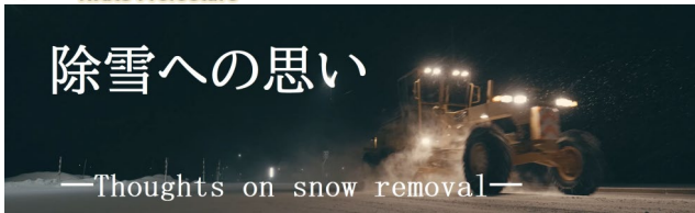
第1弾『除雪への思い—Thoughts on snow removal—』