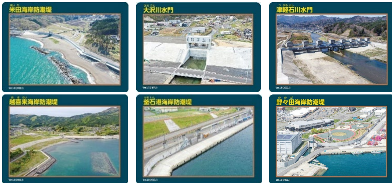
水門・防潮堤カードの例