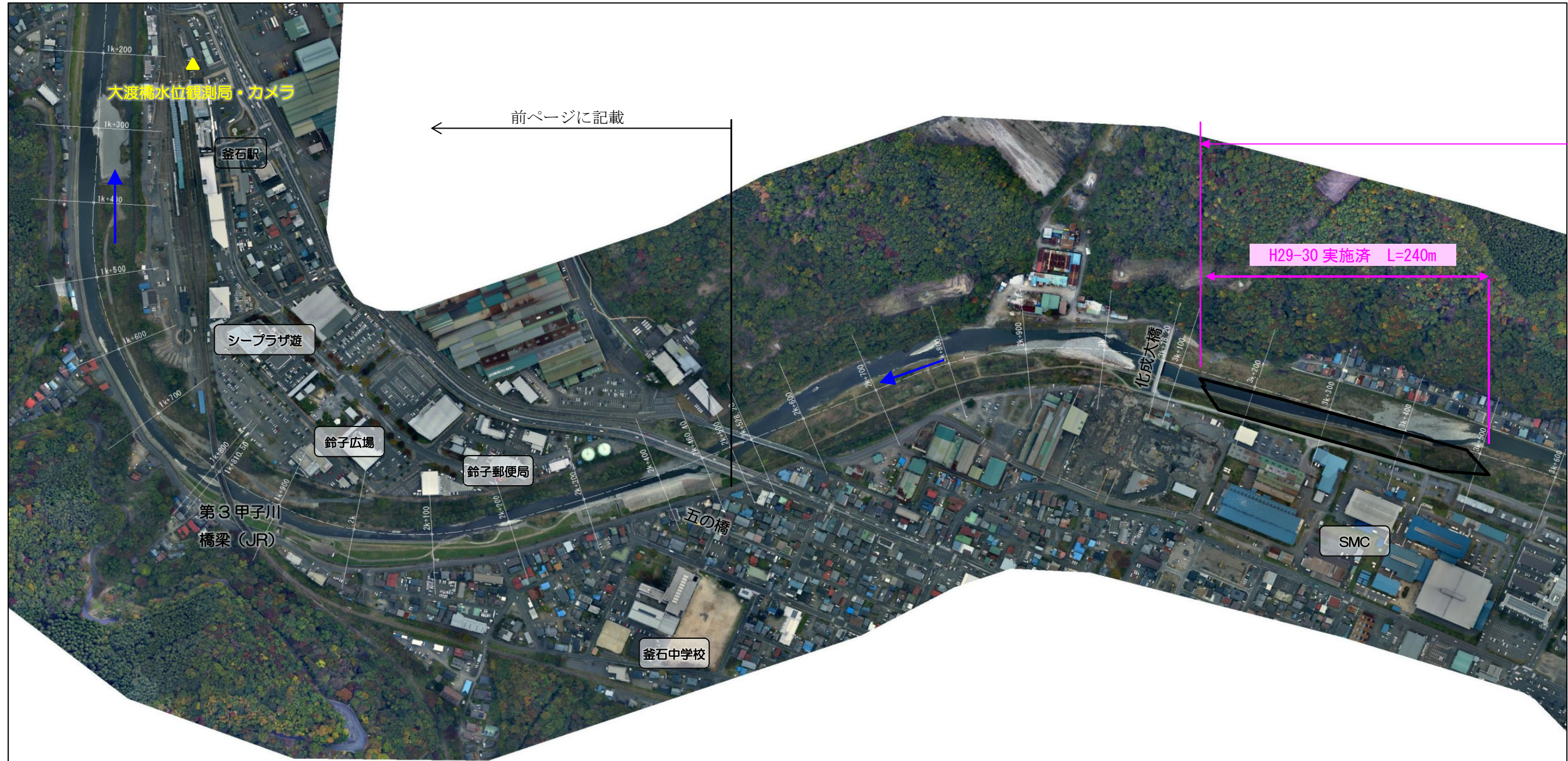
甲子川 五の橋～化成大橋付近区間 河道掘削計画平面図 (2.7k～3.4k)