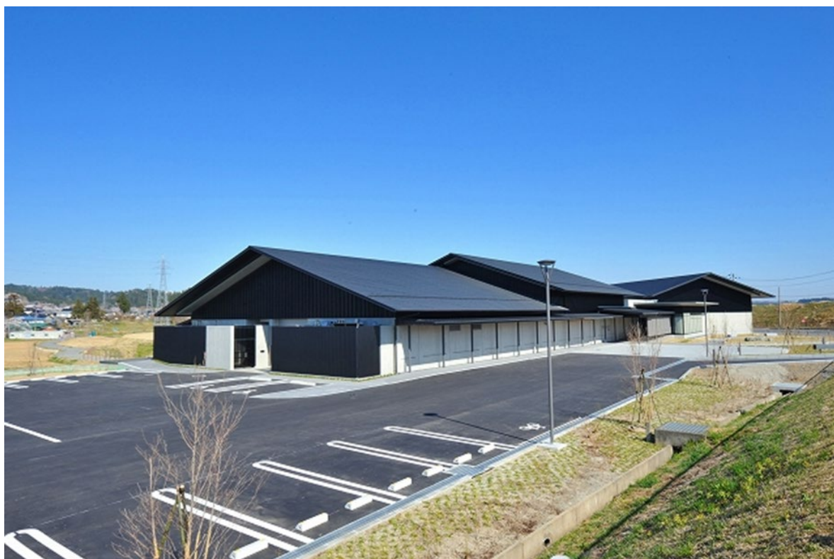
平泉の文化遺産ガイダンス施設（仮称）新築工事 令和3年4月完成