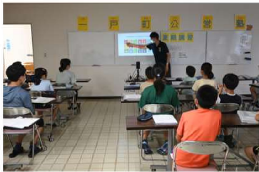
地元の高校生にボランティアを依頼 (夏期/冬期講習)