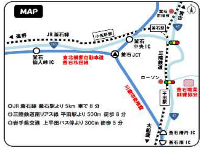
選考・訓練実施場所地図▲