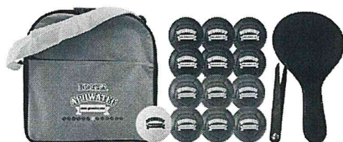
ボッチャボールセット (60 団体:対象は中学生以下)