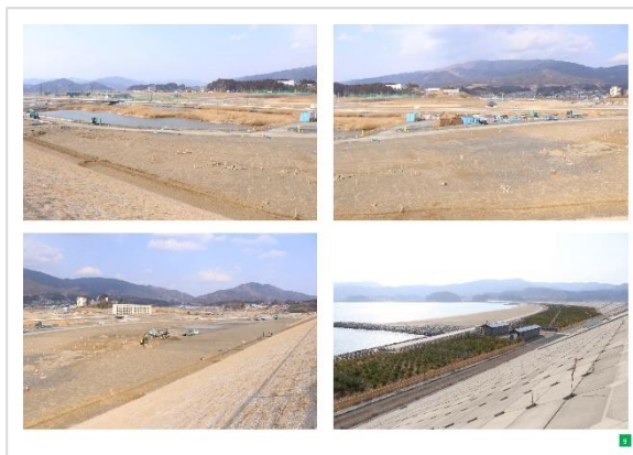
現場写真の一部(県管理棟周辺、海水浴場周辺)