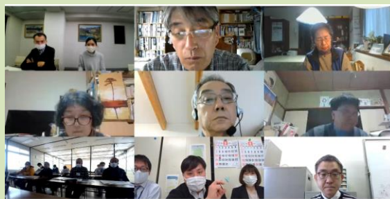
オンライン画面の様子(写真は参加者の一部です)