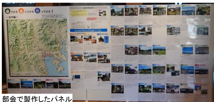
部会で製作したパネル