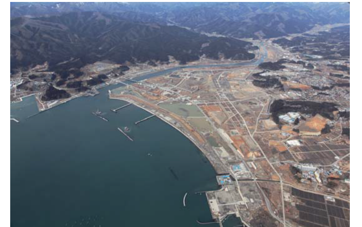
上空から見た公園予定地（平成 27 年 3 月）