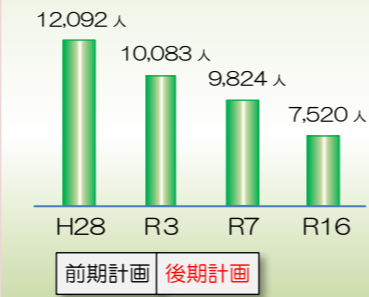
本県の中学校卒業生数の推移

地域社会に貢献する意識を醸成する教育を推進し、将来、地域で活躍し、地域を支える人材を育成することが重要となる。