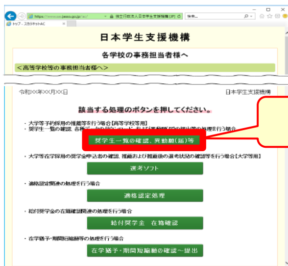
◆画面13-1 (「学校担当者用トップページ」画面)