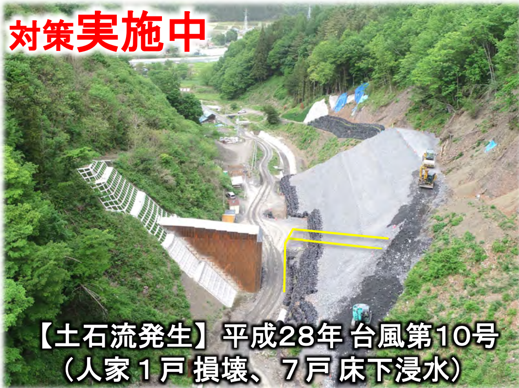
【土石流発生】平成28年 台風第10号 (人家1戸損壊、7戸床下浸水)