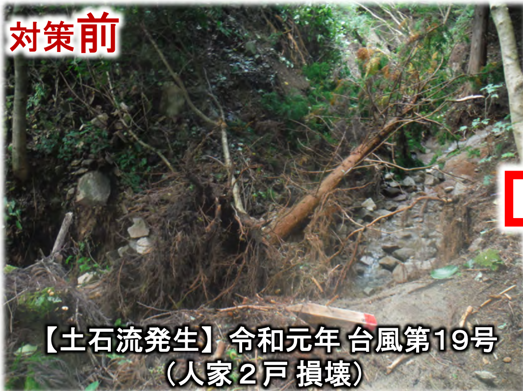
【土石流発生】令和元年 台風第19号 (人家2戸 損壊)