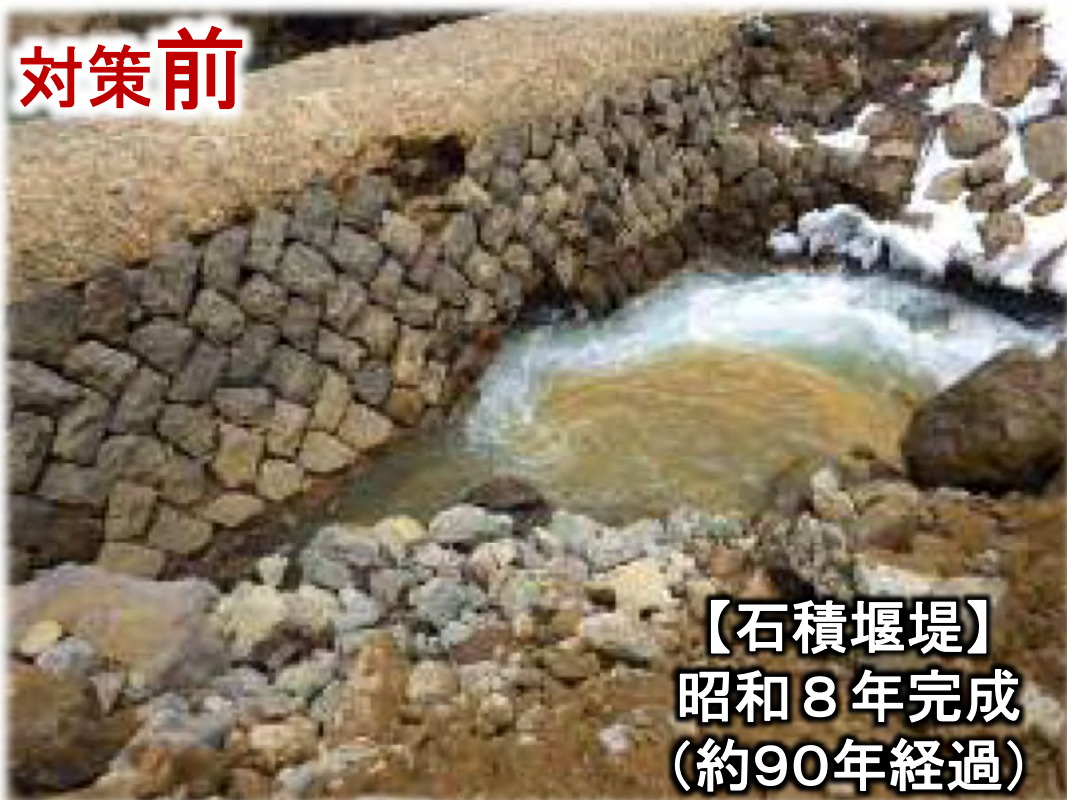
【石積堰堤】 昭和8年完成 (約90年経過)