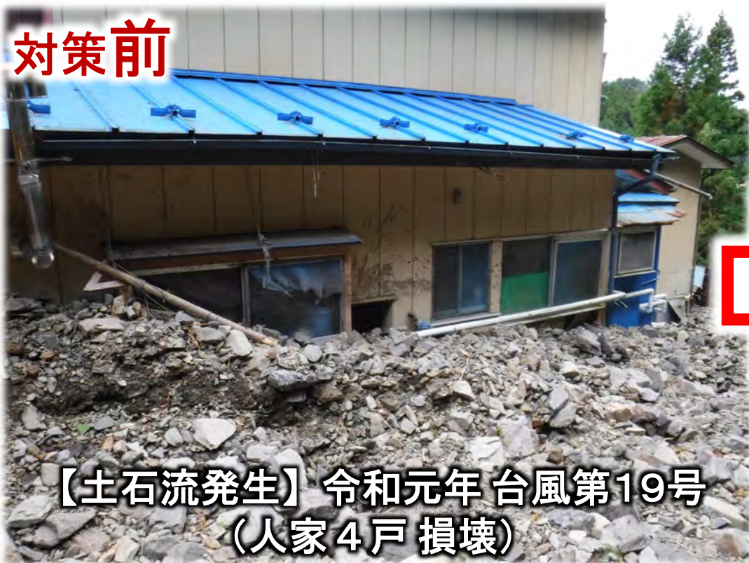
【土石流発生】令和元年台風第19号 (人家4戸損壊)