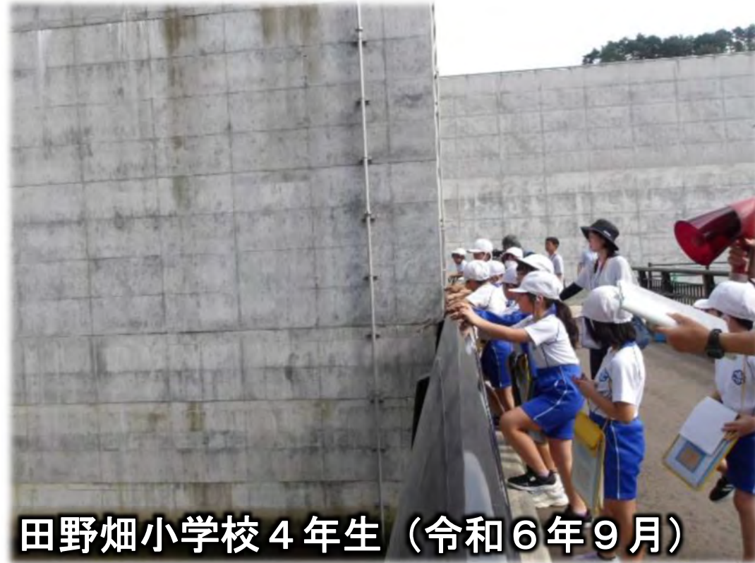
田野畑小学校 4年生（令和6年9月）