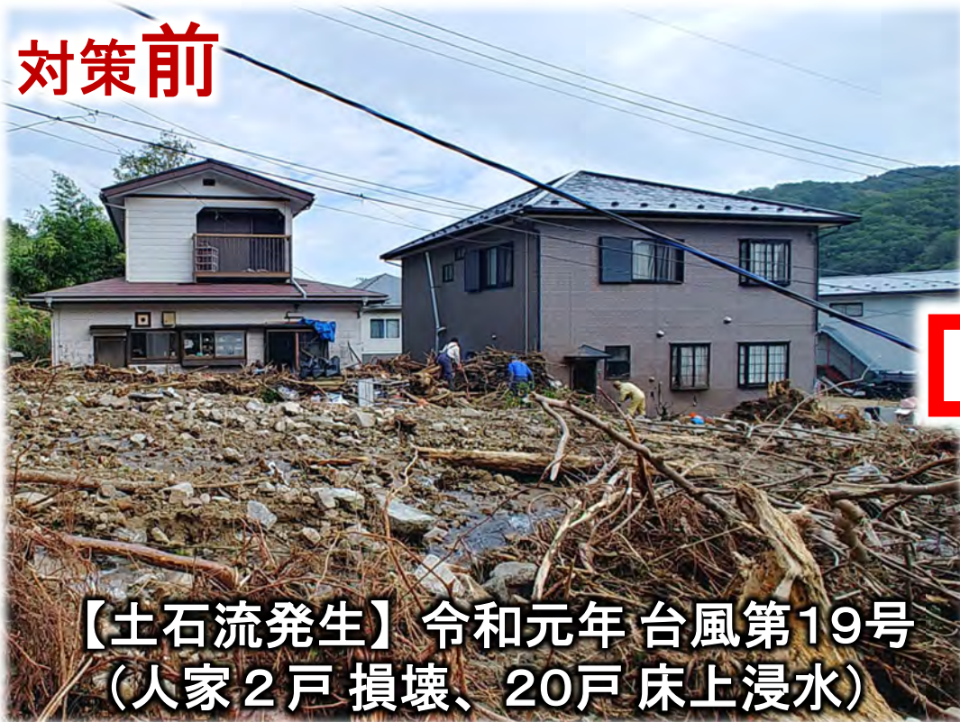
【土石流発生】令和元年 台風第19号 (人家2戸 損壊、20戸 床上浸水)