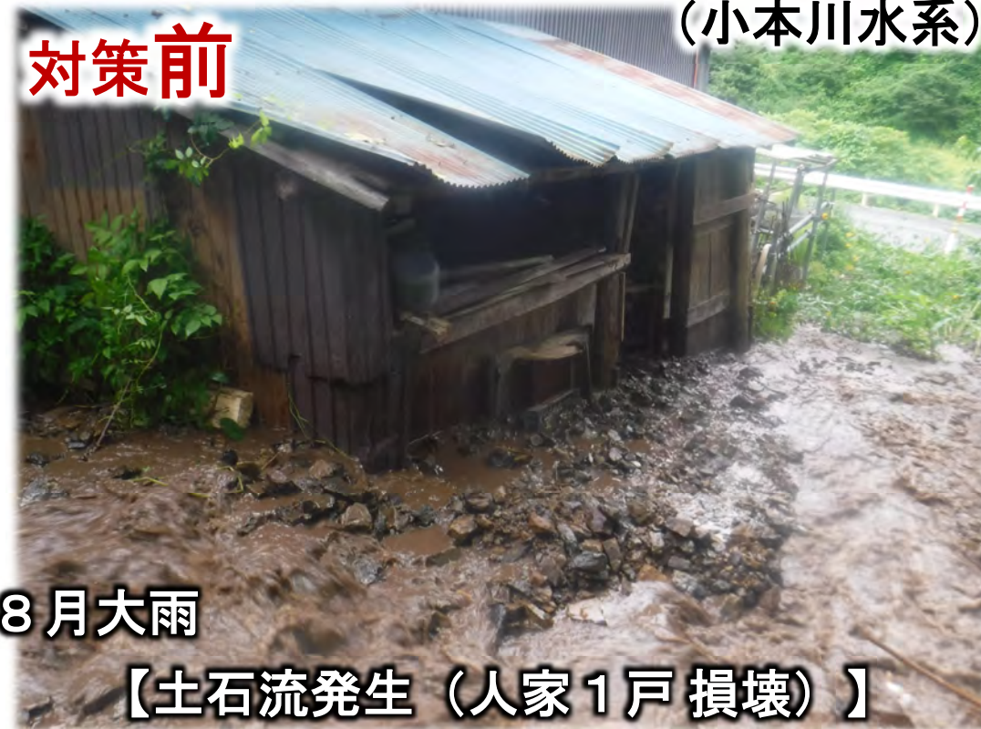
【土石流発生 (人家1戸損壊)】