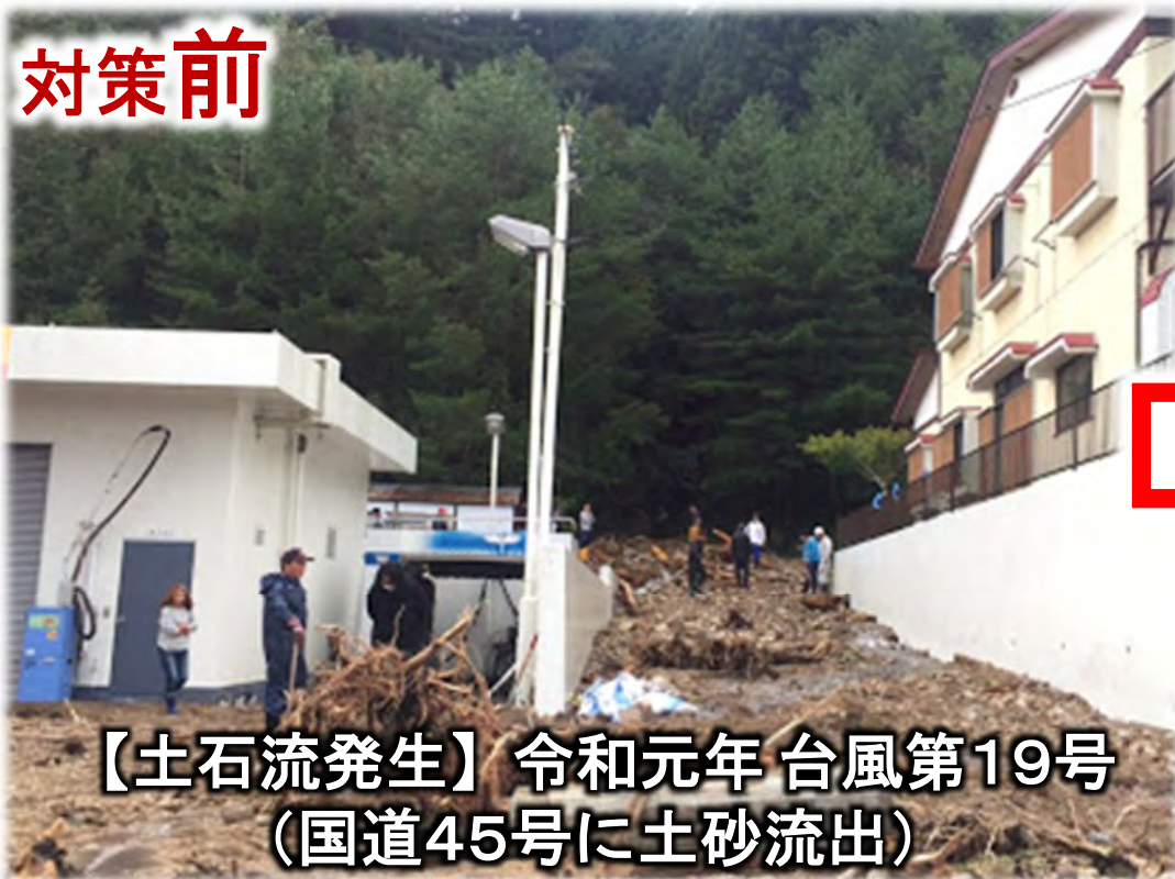
【土石流発生】令和元年 台風第19号 (国道45号に土砂流出)