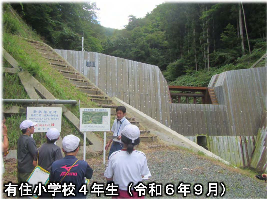
有住小学校 4年生（令和6年9月）