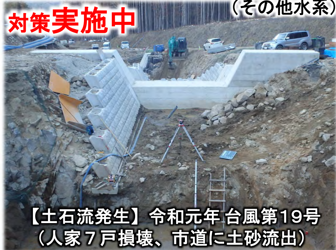
【土石流発生】令和元年 台風第19号 (人家7戸損壊、市道に土砂流出)