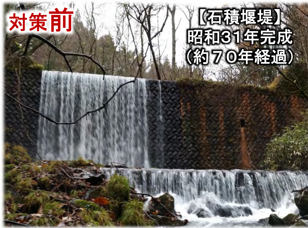
【石積堰堤】 昭和31年完成 (約70年経過)