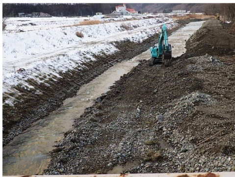
【馬淵川】泉田向橋地区