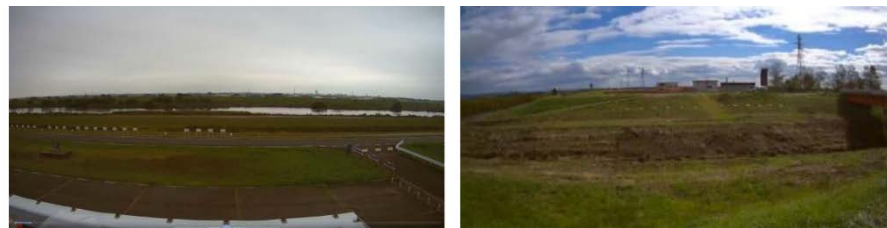
試験計測状況(上段)と撮影された画像(下段)