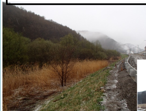
【馬淵川】河道掘削、支障木伐採候補地