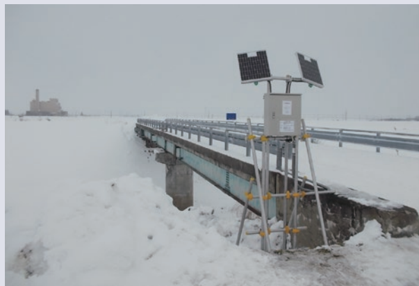
現場実証実験第二弾※寒冷地仕様(最上川水系)