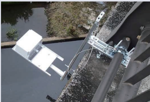
現場実証実験第一弾(鶴見川水系 鳥山川)