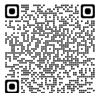
噴火速報について