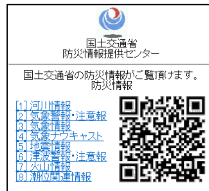
防災情報提供センター 携帯端末向けホームページ (Top)