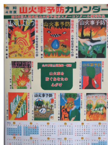
昨年度の入賞作品を使用したカレンダー