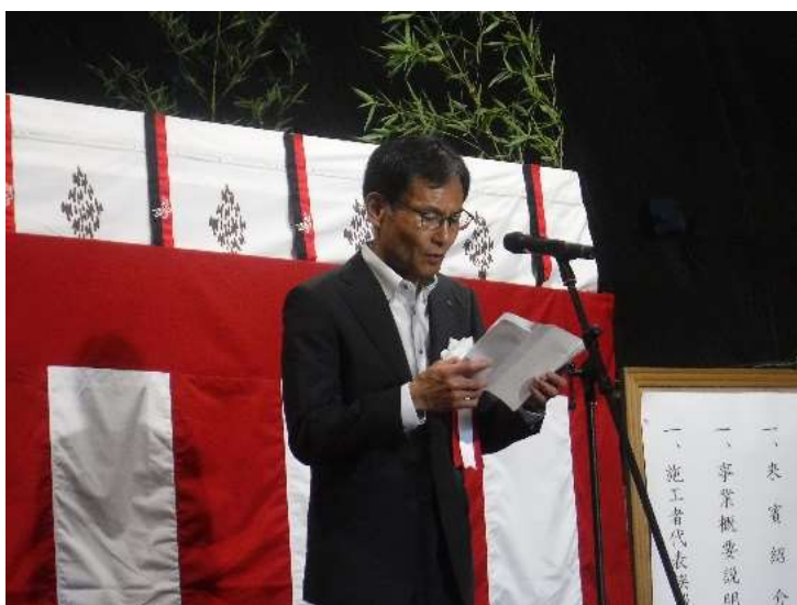
▲小島県南広域振興局長による挨拶

安全祈願祭には、県、西和賀町、地元選出県議会議員、関係機関、工事関係者など約100人が出席し、鍬入れ、玉串奉奠等の神事を行った後、小島県南広域振興局長から「早期完成に向けて、工事に全力で取り組む」旨あいさつを述べ、工事の安全と早期完成を願いました。