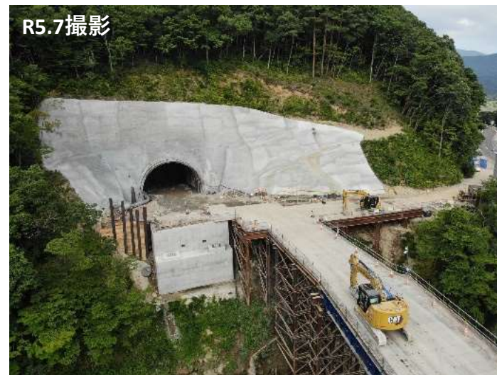
▲トンネル坑口 西和賀側