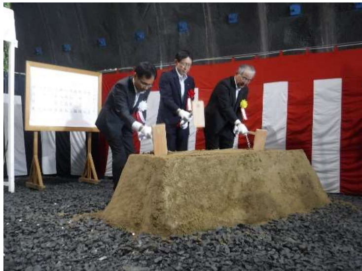
▲小島県南広域振興局長、内記西和賀町長、(株安藤・間東北支店 宮川執行役員支店長)による鍬入れ之儀（くわいれのぎ）