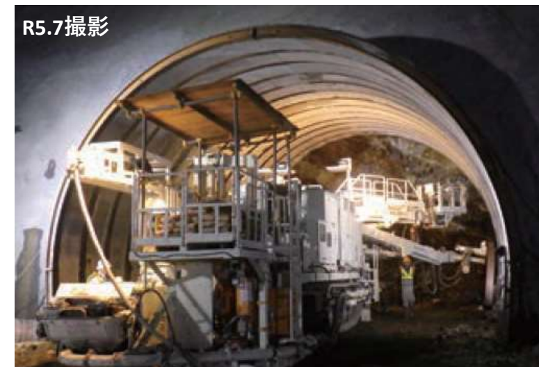
▲トンネル掘削状況