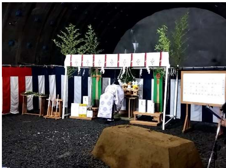
▲玉串奉奠（たまぐしほうてん）