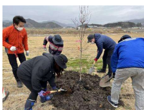
ハナミズキ試験植栽(2023/3/25)