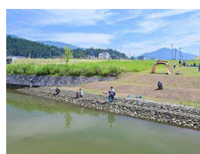
川原川であそぼう(2023/7/30)