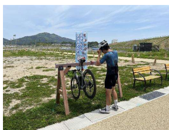
サイクリングステーション