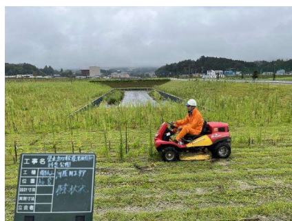
管理基準に則り草刈りを実施