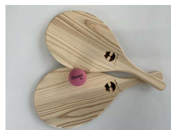
フレスコボール(観光物産協会と連携)