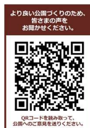
モバイルご意見箱