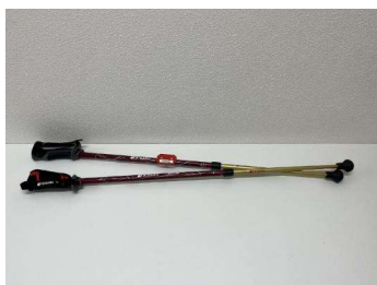
ウォーキングポール