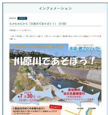
公園HPにてイベントの告知