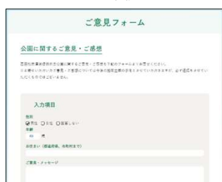
公園HPご意見フォーム