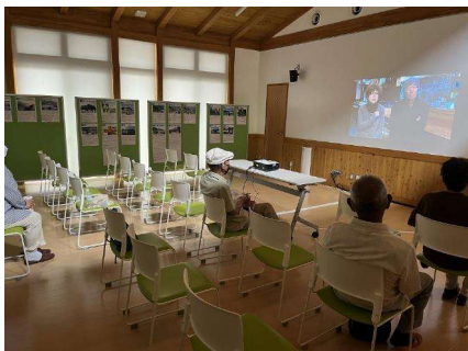
ドキュメンタリー映画上映会(7/15・16、22)