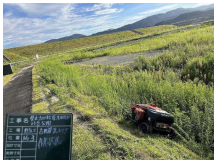
ラジコン芝刈り機の導入