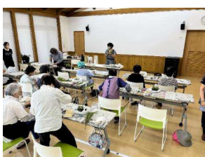
コミュニティガーデン講座(2023/7/17)