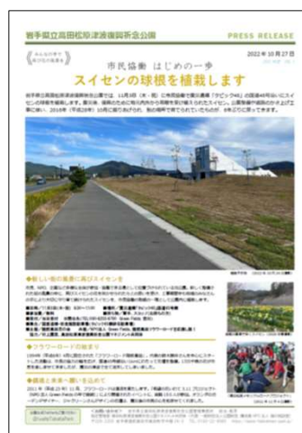
プレスリリースの配信