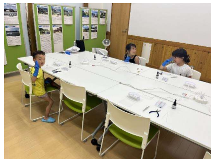
レジンクラフト「押し花キーホルダーづくり」(7/29)