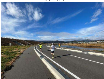
ジョギング(マラソン大会)