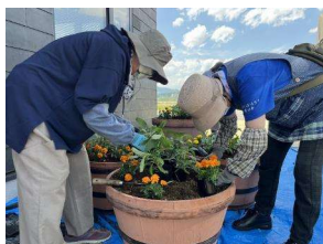
プランター植え替え(2022/6/25)