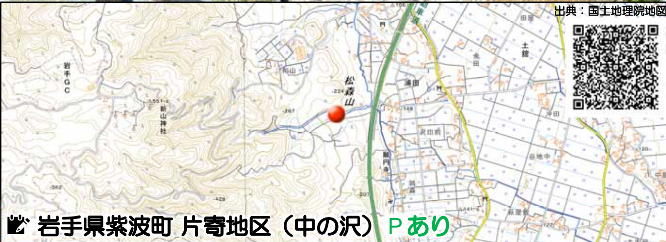
岩手県紫波町 片寄地区 (中の沢) Pあり