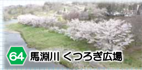
64 馬淵川 くつろぎ広場