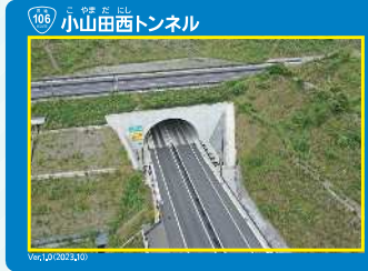
▲②小山田西トンネル