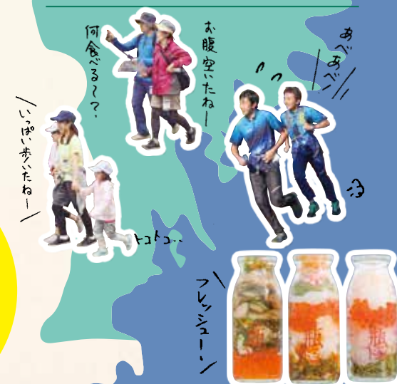
フレッシュイオン