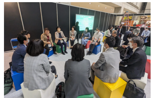
教育委員会向け研修・交流会