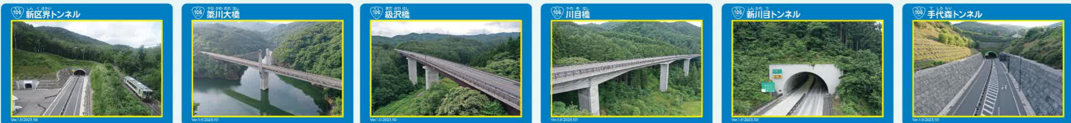
▲⑪新区界トンネル ▲⑫築川大橋 ▲⑬級沢橋 ▲⑭川目橋 ▲⑮新川目トンネル ▲⑯手代森トンネル