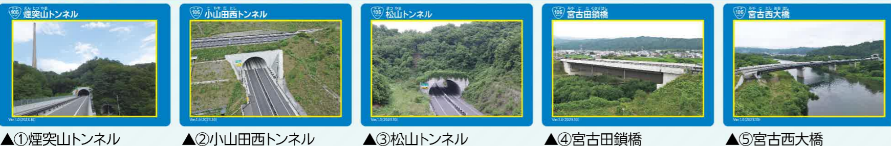
▲①煙突山トンネル ▲②小山田西トンネル ▲③松山トンネル ▲④宮古田鎖橋 ▲⑤宮古西大橋