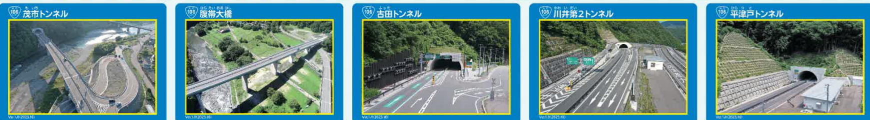
▲⑥茂市トンネル ▲⑦腹帯大橋 ▲⑧古田トンネル ▲⑨川井第2トンネル ▲⑩平津戸トンネル