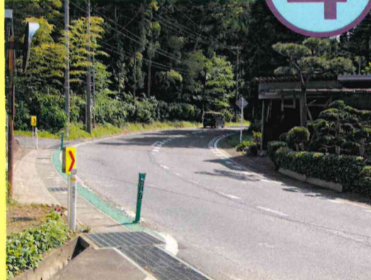
前沢生母字南在地内から字竹ノ内地内までの区間の急カーブの解消に係る改良整備