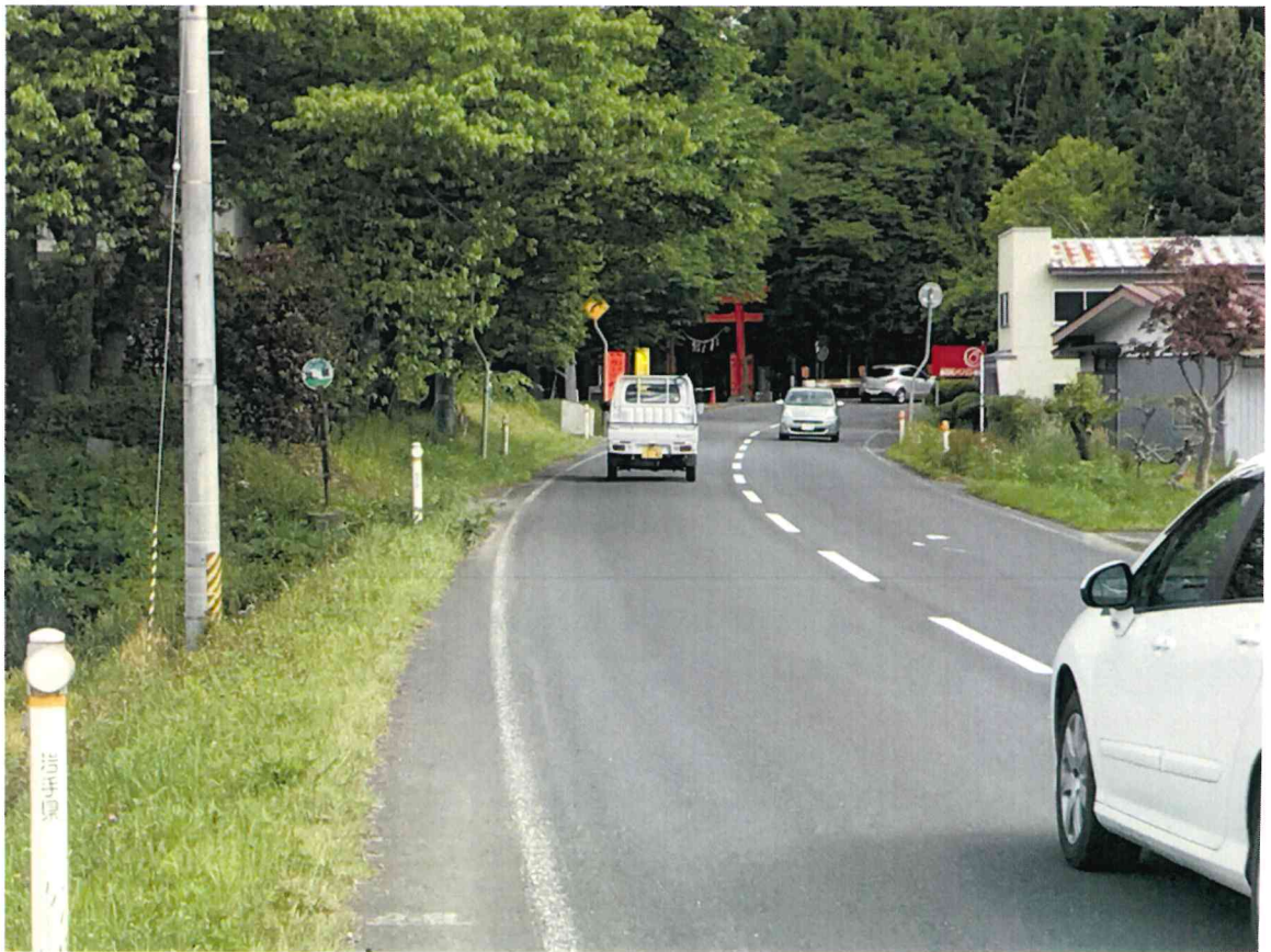
【奥州市水沢黒石町地内急カーブ狭隘区間】