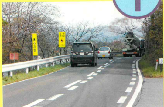
黒岩地区(670m)の改良整備の促進