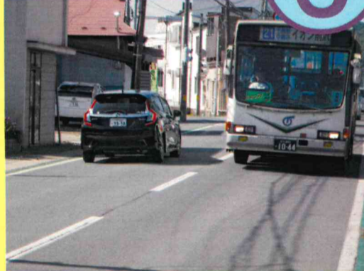
都市計画道路山目駅前釣山線の事業完了区間以北の改良整備の早期事業化