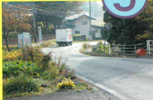
長島字山王地内から同竜ヶ坂地内までの区間(1,960m)の路線変更を含む歩道拡幅、急カーブの解消工事の促進