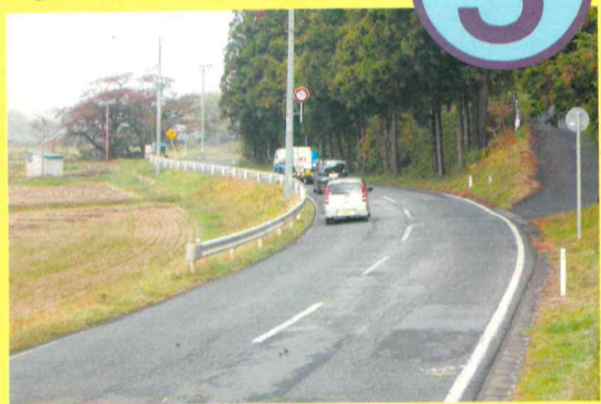
水沢黒石町字鶴ノ木地内から字下柳地内までの区間の北上川洪水時交通確保対策及び急カーブの解消に係る改良整備