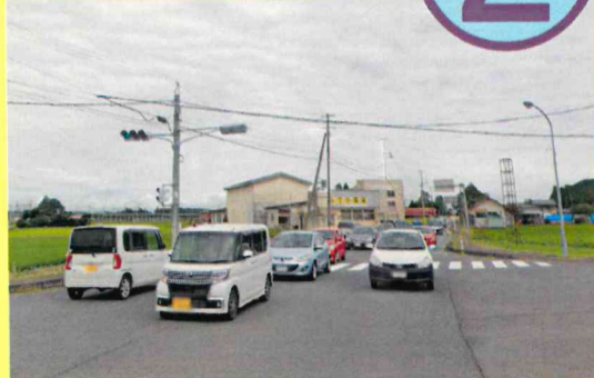
江刺稲瀬字山下地内(250m)の歩道整備の促進