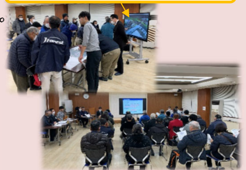
住民説明会の様子