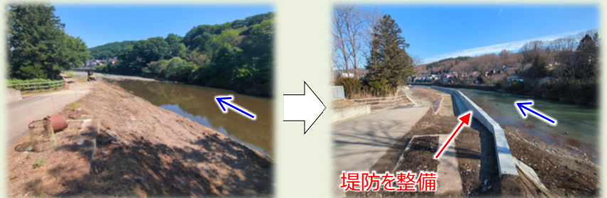
その3工事 着工前後写真