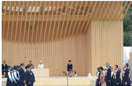
表彰(緑化功労者、各種コンクール)