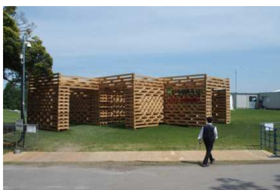
式典会場入口ゲート