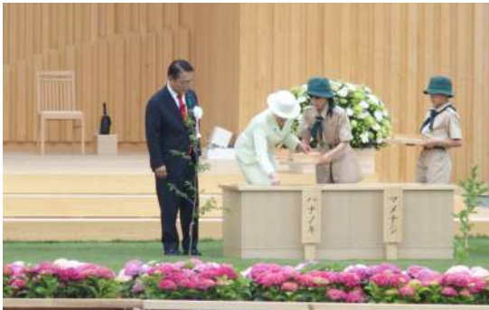
皇后陛下によるお手播き