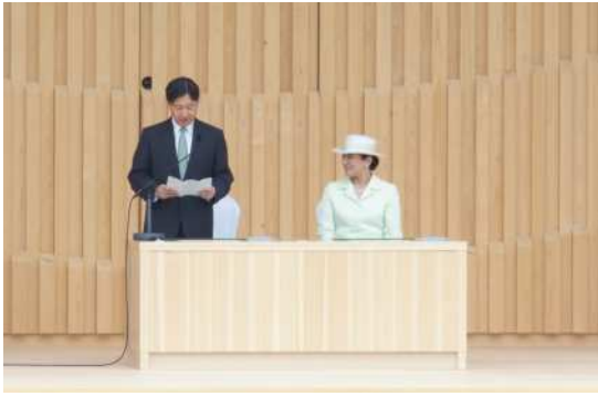
天皇陛下のおことば