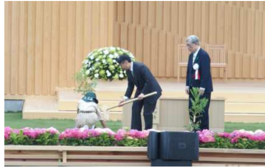
天皇陛下によるお手植え