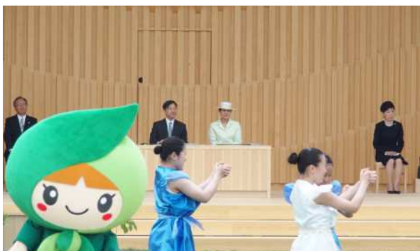
メインアトラクション