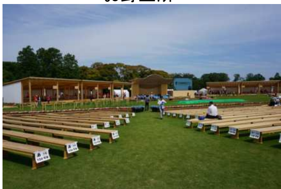
木製ベンチ(招待者席)