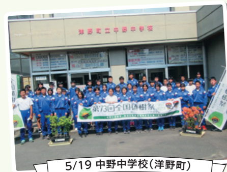
5/19 中野中学校(洋野町)