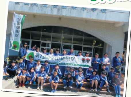
5/10 世田米小学校(住田町)