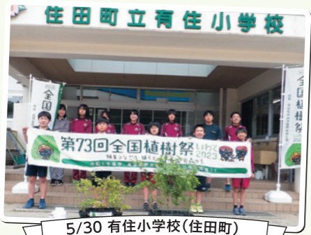
5/30 有住小学校(住田町)

森林の役割や森林づくりの大切さを子供たちに普及啓発するとともに全国植樹祭の開催に向けた機運を盛り上げていきます!