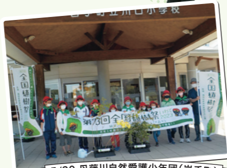
5/30 丹藤川自然愛護少年団(岩手町)