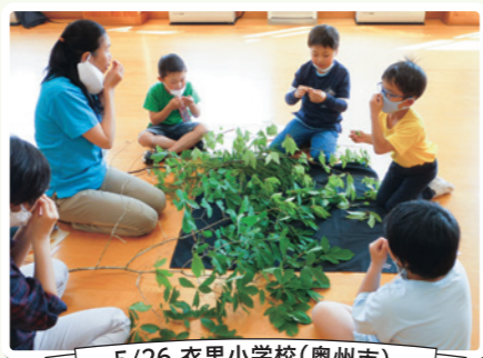
5/26 衣里小学校(奥州市)