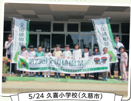
5/24 久喜小学校(久慈市)