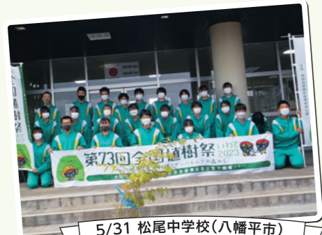
5/31 松尾中学校(八幡平市)