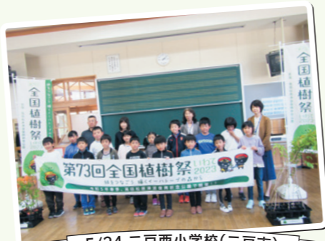
5/24 二戸西小学校(二戸市)