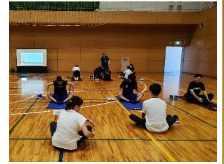
体組成測定、体力測定、運動機能チェックなど