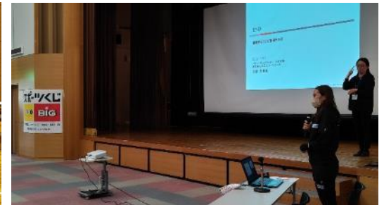
各分野の専門家による講義、個別トレーニング研修、パラリンピック選手による講話など

他にも様々なスポーツに取り組んでみたい方は、岩手県障がい者スポーツ協会ホームページをご覧ください。