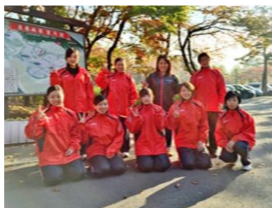
元気に活動する陸上部