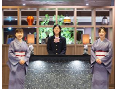
笑顔のおもてなし