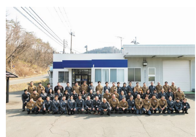
社会・地域・仲間とともに成長し続ける会社です。