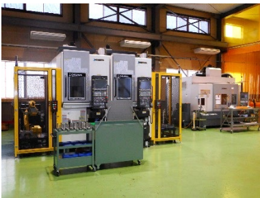
ロボット対応型5軸制御MC