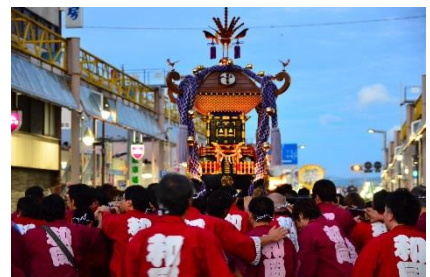
花巻祭りに神輿で参加