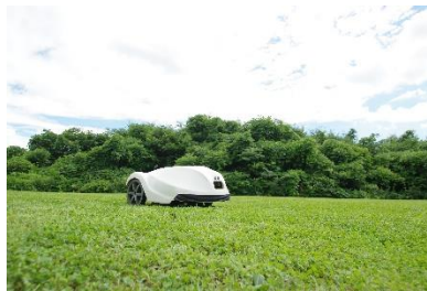
日本初のロボット草刈機

県内でも数少ない開発から 完成機の組立を行う メーカーです。自分たちが困っていることを自分たちの手で造り解決する。安心・安全で快適な生活を実現するための独創的でユニークな商品を作っています。