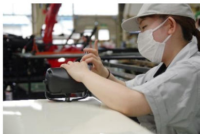
女性も活躍できる環境です

お互いの意見を尊重しながら 助け合う 関係を構築しています。優しく、時には厳しく、相談も親身になって聞いてくれる。WADOには一緒に成長する仲間がいます。