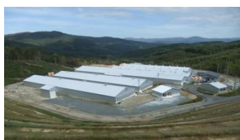
本社・養豚（繁殖農場）