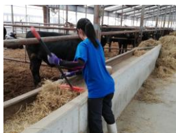
子豚の世話をしている様子です