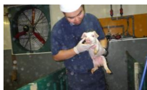
子豚の状態を診ている様子です