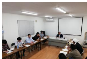
役員も交えた全社員事業検討

仕事のスキルアップだけではなく、人間的な成長や将来リーダーとして活躍できるように先輩社員の指導や研修を幅広く準備しています。月1回の定例事業検討会では、全社員参加で会社の内情をオープンにし、風通しの良い職場づくりをしています。