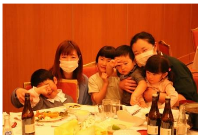
毎年恒例の職員交流会 子連れで参加も大歓迎！