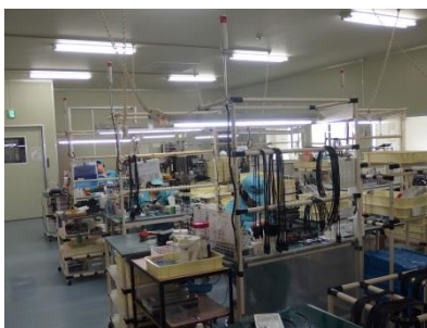
ガラス等の部品を組立

工場などの排水の分析、監視に使用される水質測定器のセンサー部分に使用されるガラス電極の製造、組立を行っています。