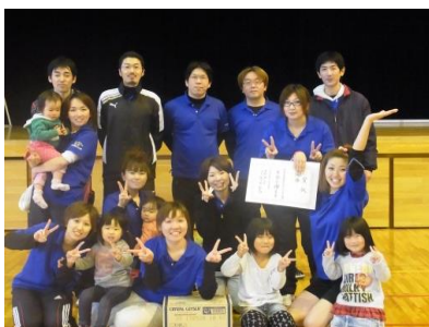
ソフトバレーボール大会の様子