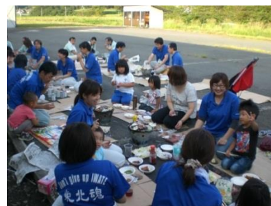
ジンギスカンパーティーの様子